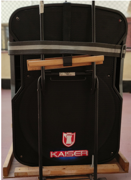
← Front, with LED decoration

Batteries and voltage / current indicator. Wireless mono. →